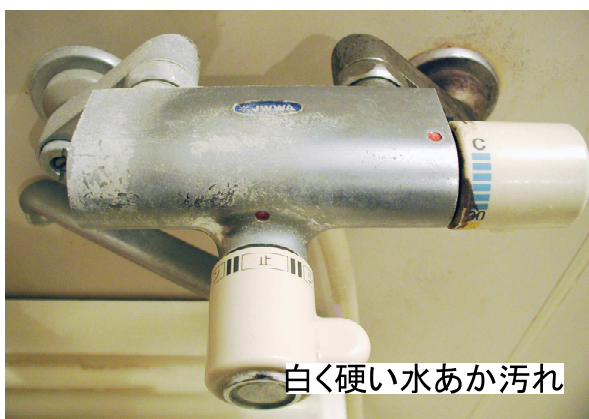
白く硬い水あか汚れ