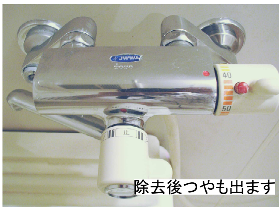
除去後つやも出ます